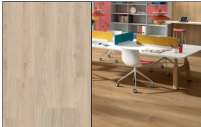
● Roble Loira Tibet