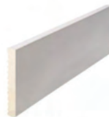
90 x 10