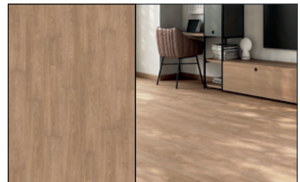
● Roble Gaia Dolomites