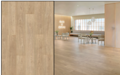
● Roble Kalmar Esencia

En Maderas Santana, ponemos a tu disposición la gama FINfloor para que encuentres la solución perfecta con el asesoramiento técnico que necesitas en cada proyecto.