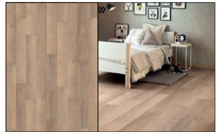
● Roble Serrado