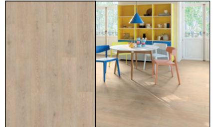
● Roble Fado Brisa