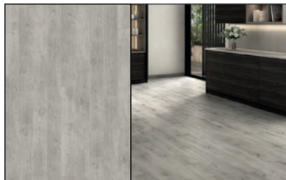
● Roble Calcic