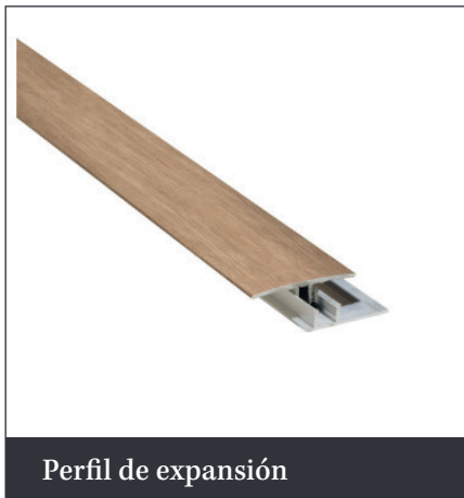
Perfil de expansión