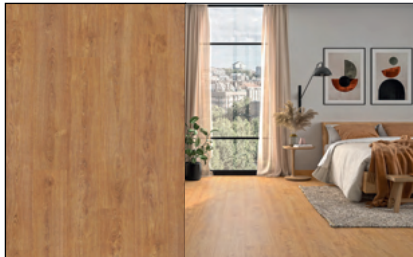
● Roble Cartago

En Maderas Santana, encontrarás Purefloor 8 con el respaldo y asesoramiento profesional para elegir el suelo que mejor se adapte a cada proyecto.