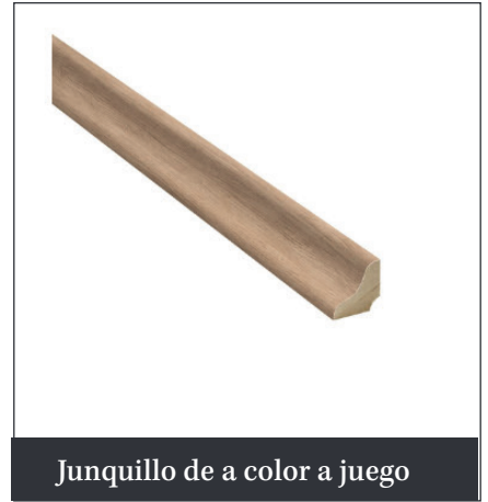
Junquillo de a color a juego