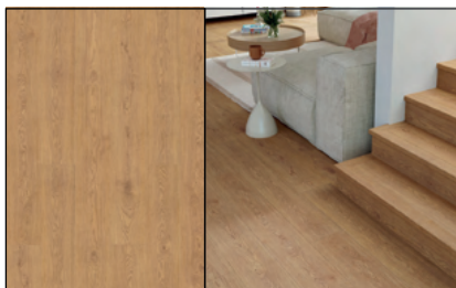
● Roble Ambar Tibet