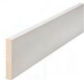
70 x 12