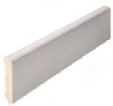
50 x 10

Se fabrican en largo de 2.200 mm y 2.750 mm