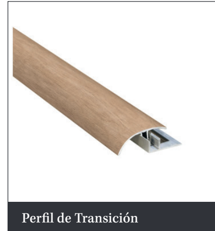
Perfil de Transición