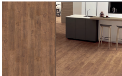
● Roble VintageDry Touch