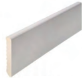
70 x 10