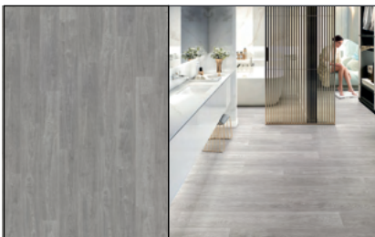
● Kalmar Gris Oak