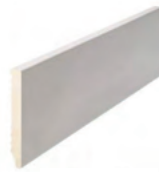
90 x 10