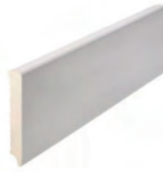
85 x 13