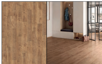
● Roble Retro