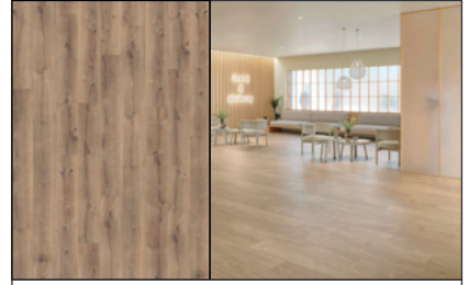
● Roble Obelisque