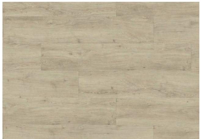
RIGID ACOUSTIC SUNNY LIGHT