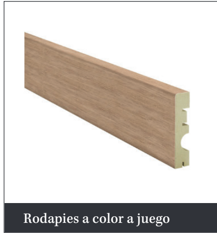
Rodapiés a color a juego