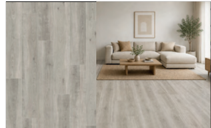
● Roble Pausa Luxor