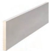
90 x 10