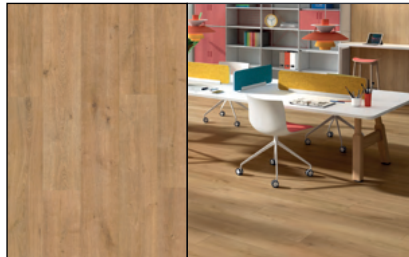
● Roble Vera Homenaje