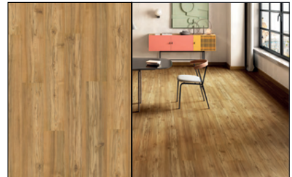
● Teka Tasmania