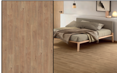
● Roble Arles Natural