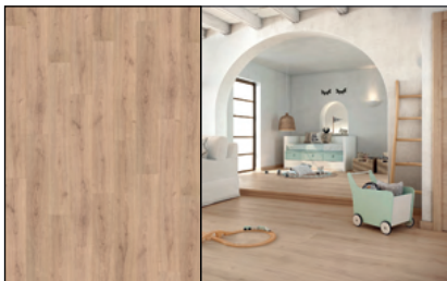
● Roble Kalas Arenar