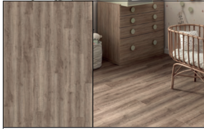
● Roble Banff