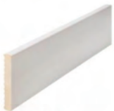
70 x 10

Se fabrican en largo de 2.200 mm y 2.750 mm