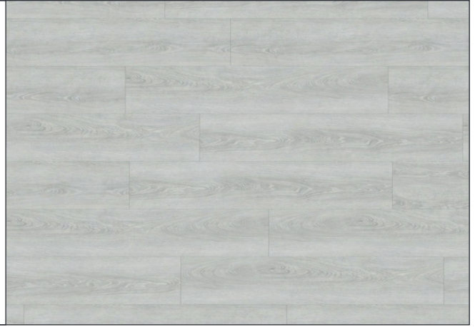
RIGID ACOUSTIC BOHEM LIGHT GREY