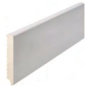
90 x 14