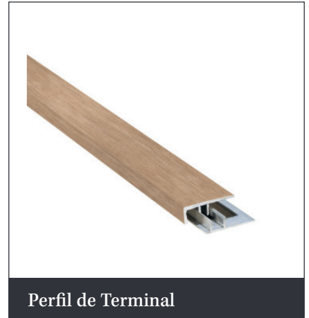
Perfil de Terminal