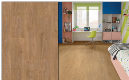
● Roble Viena